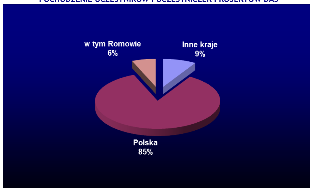
WYKRES 2 POCHODZENIE UCZESTNIKÓW I UCZESTNICZEK PROJEKTÓW DAS

Liczba uczestników i uczestniczek łącznie: 3089